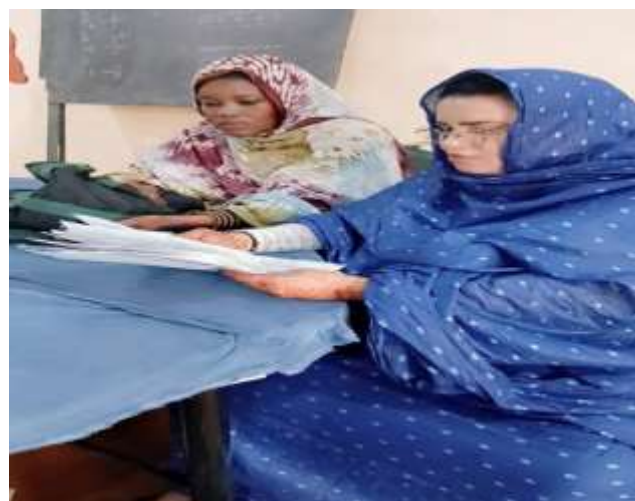
Figure 8 : vérification des fiches de synthèse avant la saisie