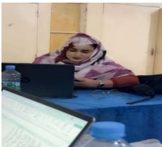
Figure 7 : PF SNIS Moughataa

Le PF SNIS de la Moughataa, appuyé par sa suppléante saisissait par jour les données de la campagne.