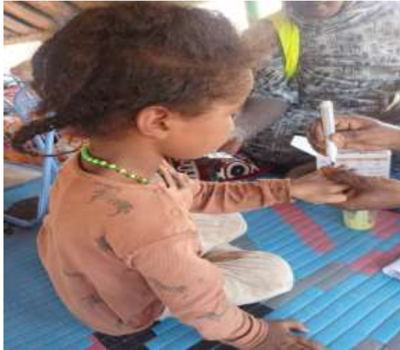
Figure 3 : Suivi du marquage du doigt d'un enfant