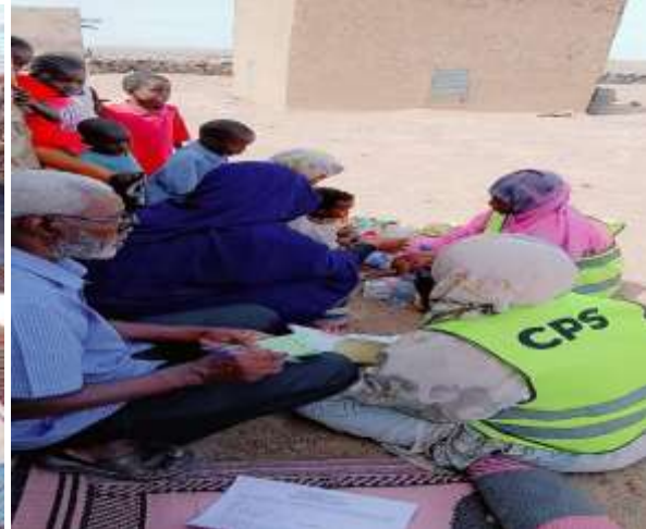
Figure 6 : supervision par le niveau central/niveau Moughataa

Le PF SNIS de la Moughataa, appuyé par sa suppléante saisissait par jour les données de la campagne.