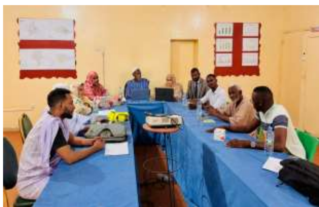
Figure 2 : Réunion de restitution journalière