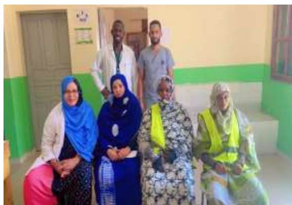
Figure 1 : Supervision niveau Moughataa / Major

Cette mission s'est déroulée du 13 au 22 septembre 2025. Le MCM et son équipe cadre ont veillé au démarrage effectif de la campagne dans l'ensemble de leurs postes de santé respectifs en assurant la disponibilité des médicaments SPAQ en quantité suffisante ainsi que des supports et du matériel de distribution des médicaments de la CPS. Les supervisions ont été effectuées par tous les niveaux.