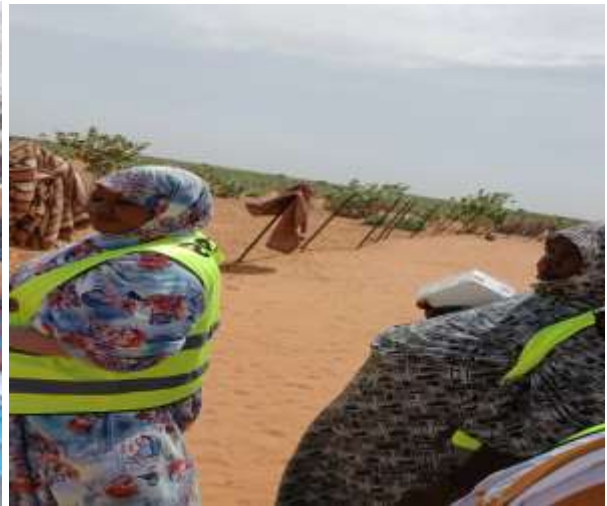
Figure 4 ; supervision niveau Moughataa dans les champs