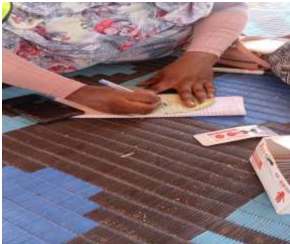
Figure 5 : Supervision niveau CS/PS